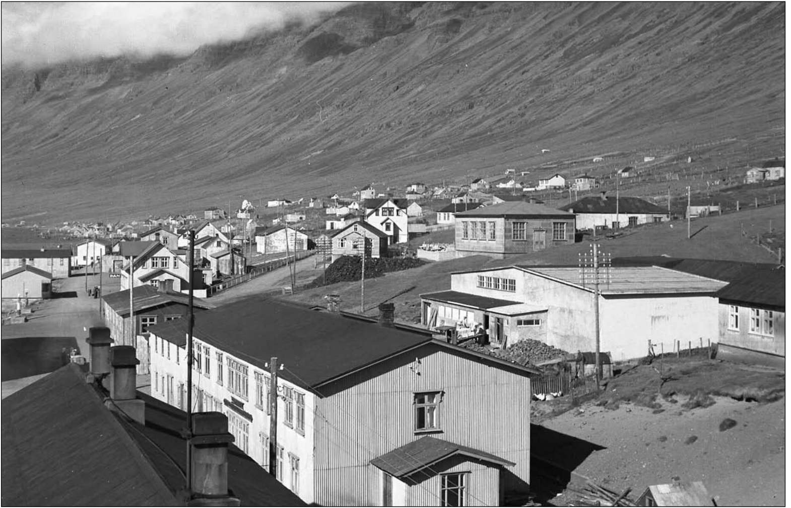
Horft inn yfir Stekkjarnesið 1939. Húsið fremst á miðri mynd er Verslunarhús Konráðs Hjálmarssonar, bak við það er gamla frystihúsið og á hólum þar innaf er Gúttó, samkomuhús Norðfirðinga til fjölda ára.