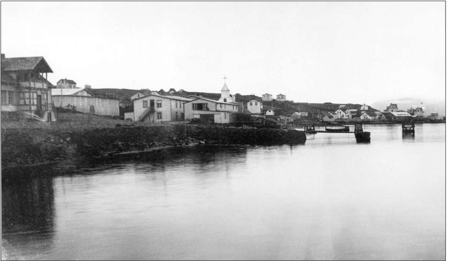
Fremst á myndinni er athafnasvæði Gísla Hjálmarssonar kaupmanns en myndin er tekin um 1915. Lengst til vinstri er verslunar- og íbúðarhús kaupmannsins, þá sést íshúsið, síðan Sómastaðir sem var fiskverkunarhús með íbúðarherbergjum á efri hæð og loks tvílyft fiskgeymsluhús með áföstum skúrum og fiskpalli. Húsið Sómastaðir hýsti lengi bæjarskrifstofur Neskaupstaðar á efri hæð og á jarðhæð var áhaldahús bæjarins.