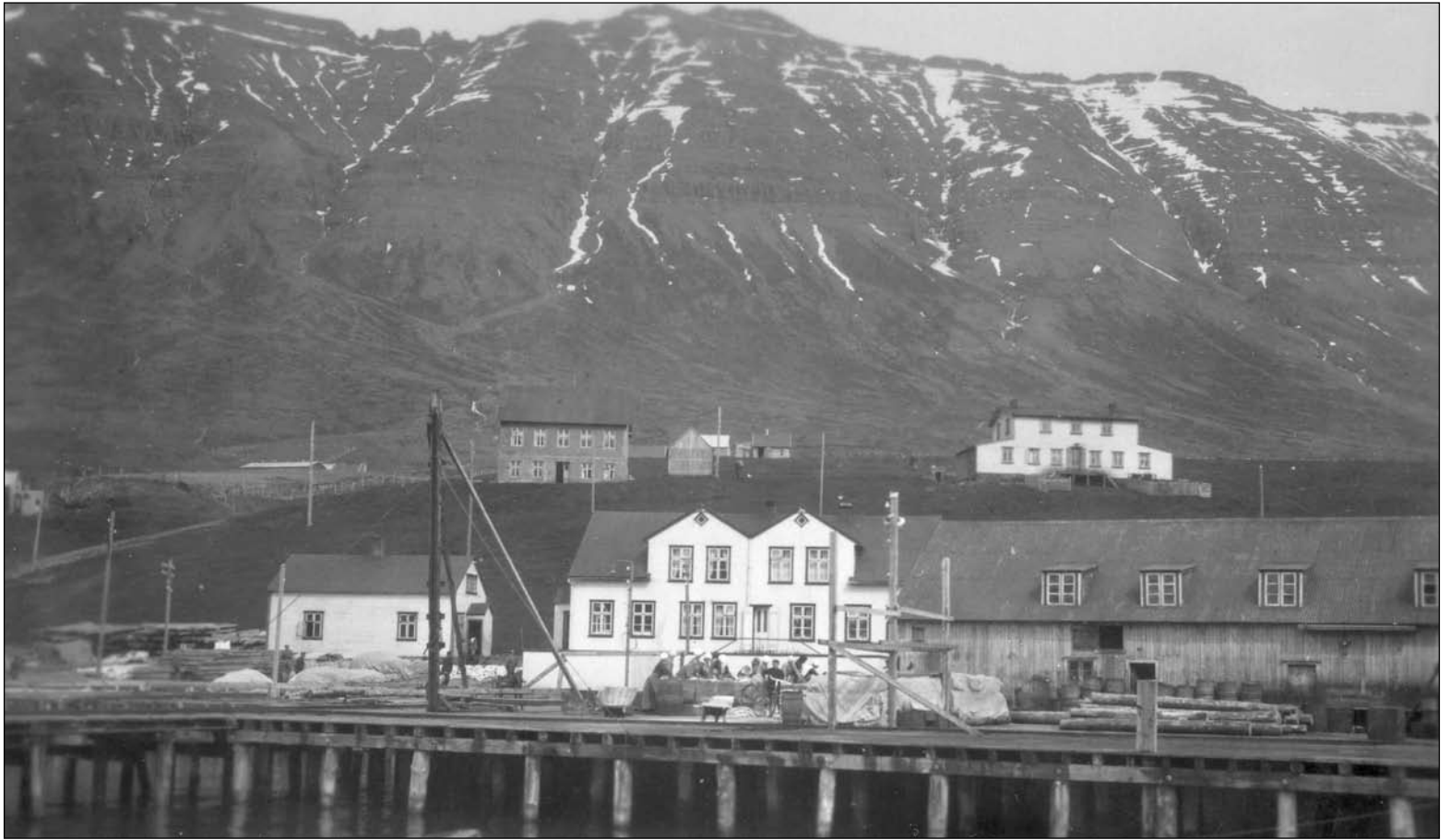
Athafnasvæði Sigfúsar Sveinssonar um 1925. Á myndinni sést greinilega fólk við fiskverkun. Húsin fremst á myndinni eru vörugeymslur og útgerðarhús. Lengst til vinstri er Bakaríð en þar var brauðgerð kaupmannsins til húsa á árunum 1906 – 1911. Þá sést verslunar- og íbúðarhús kaupmannsins sem reist var á árunum 1894 – 1895. Uppi í hlíðinni sjást Fram-Ekra og Út-Ekra.