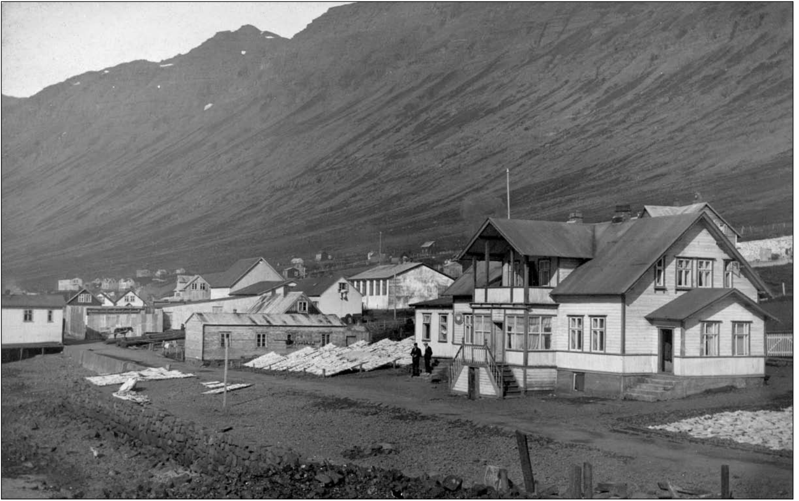
Athafnasvæði Hinna sameinuðu íslensku verslana á Stekkjarnesi um 1920. Húsið lengst til hægri er verslunar- og íbúðarhúsið en það var áður í eigu Gísla Hjálmarssonar, kaupmanns. Næsta hús við götuna er Sjólyst og yfir því sér í húsið á Nesstekk. Lengst til vinstri sér í Bryggjuhúsið og fjær má sjá pakkhús Konráðsverslunar, Krosshús og barnaskólann. Upplýsingar úr bókinni Norðfjarðarsaga I. bls. 191.